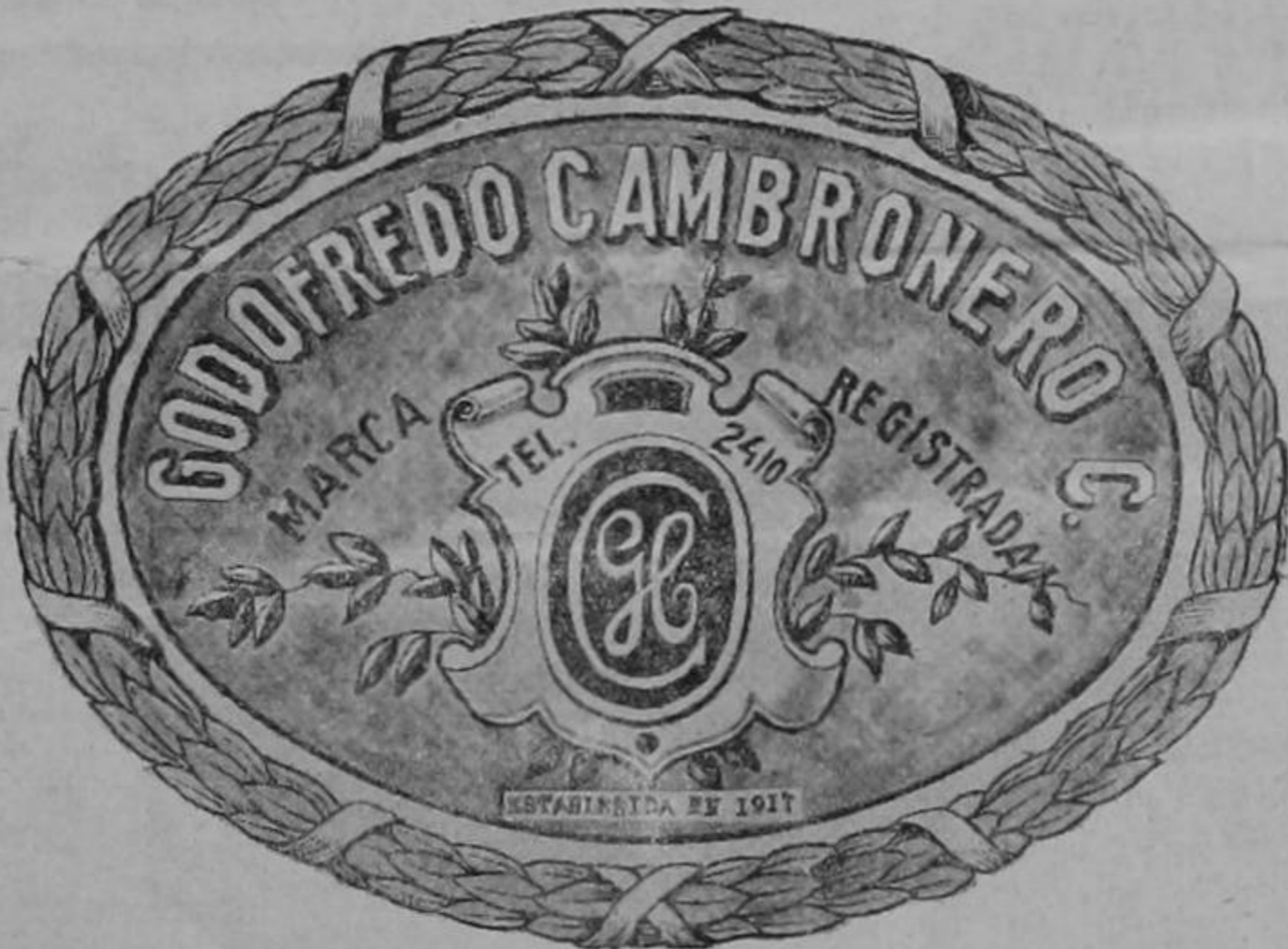
Propietario de la Fábrica LA SELECTA